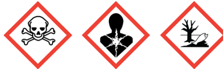
GHS06 GHS08 GHS09